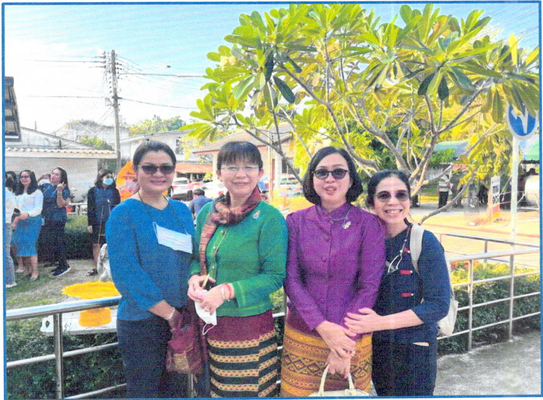
กิจกรรมการแต่งชุดปฏิบัติงานในวันจันทร์ และชุดไทยในวันศุกร์.