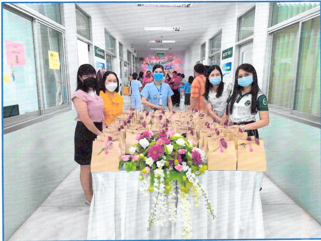
กิจกรรมความเสียสละ งานผู้ป่วยในจัดทำโรงพยาบาลเลียงอาหารบุคลากร รพ.ลับแล และจัดชุดของขวัญแจกคนไข้ ในช่วงเทศกาลปีใหม่ ๒๕๖๕