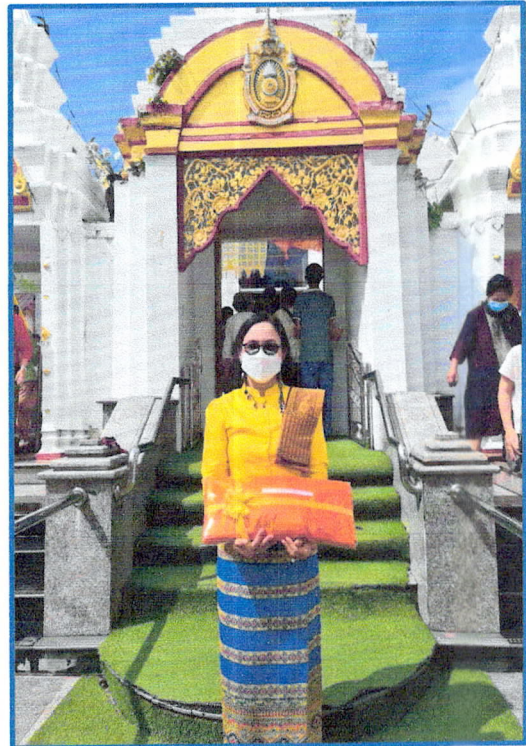
กิจกรรม ส่งตัวแทนร่วมงานบุญกุฐิน กับเครือข่ายวัดในชุมชน วันที่ ๔ พ.ย.๖๔