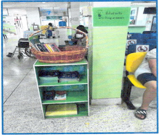
กิจกรรมตู้หนังสือธรรมะและอ่านเล่นในแต่ละจุดบริการ