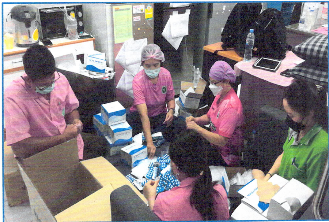
กิจกรรมจิตอาสาในสถานการณ์โควิด-๑๙ ตั้งแต่ ๑ ตุลาคม ๒๕๖๓-๒๕ มีนาคม ๒๕๖๕