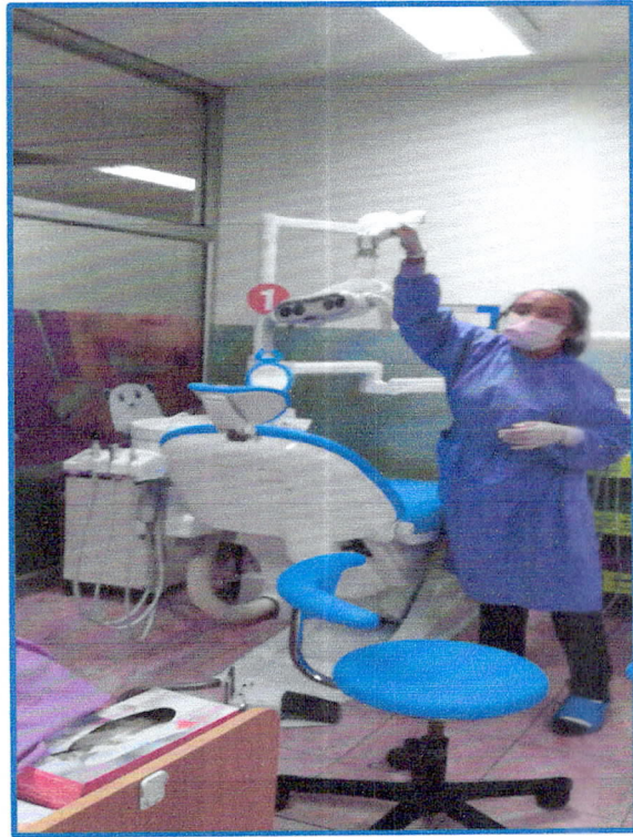
กิจกรรม ๕ ส.ทุกวันศุกร์ ในจุดบริการของตนเอง