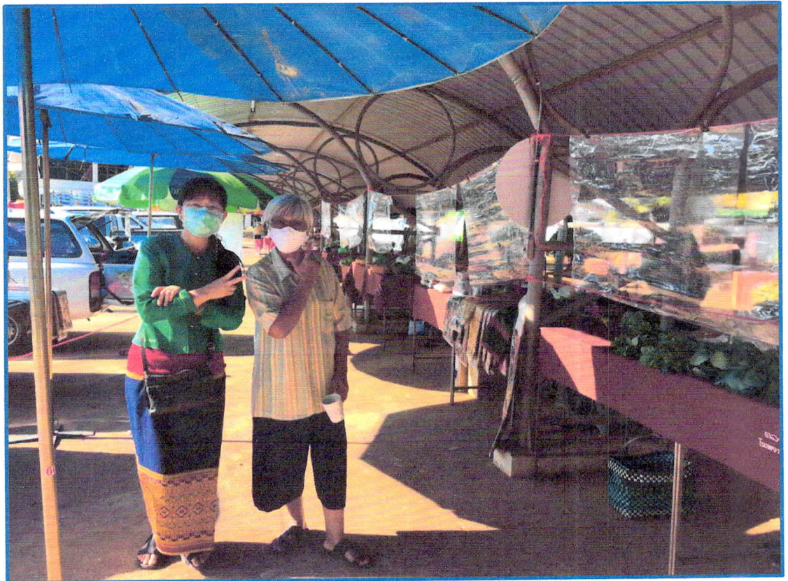
กิจกรรมตลาดสี่เหลี่ยม มีหลายหน่วยงานที่เกี่ยวข้อง เช่น รกส. จิตอาสา ทุกวันพุธ (จิตอาสาร้องเพลง,เปิดท้ายขายเสื้อผ้ามือ ๒ กองทุนเมตตา)