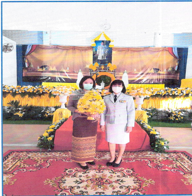
กิจกรรมแสดงความจงรักภักดีต่อสถาบันพระมหากษัตริย์ วันที่ ๒๓ ตุลาคม และ ๕ ธันวาคม ๒๕๖๔.